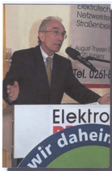
Staatssekretär Harald Glahn beglückwünschte die Firma für die erfolgreiche Nachfolge und damit die Sicherung der 80 Arbeitsplätze.