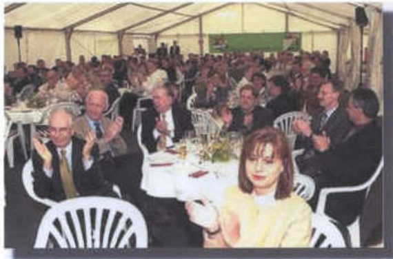
Ein vollbesetztes Zelt: Die Betriebsangehörigen waren sichtlich erfreut.